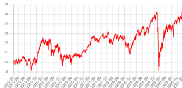
A股累計美元(避險) (美元)

資料來源：Lipper, 截至110年3月31日。 此級別的成立日 - 103年1月10日