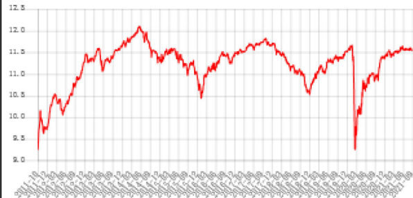
A股歐元月配息 (歐元)

資料來源：Lipper, 截至110年9月30日。 此級別的成立日 - 92年6月09日