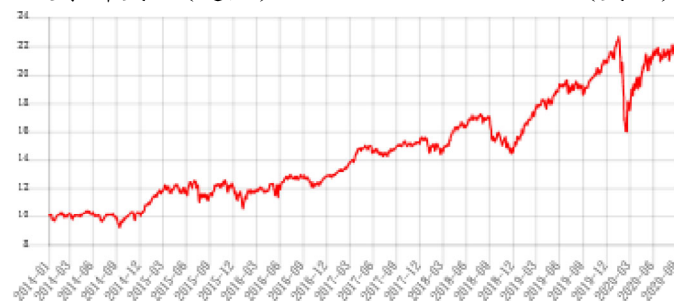
A股累計美元(避險) (美元)

資料來源：Lipper, 截至109年9月30日。 此級別的成立日 - 103年1月10日