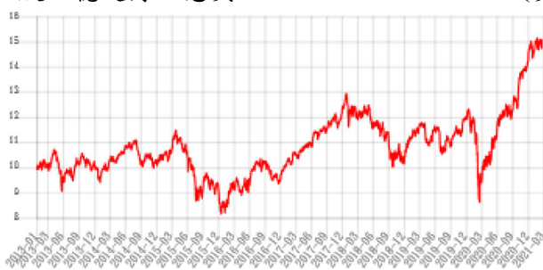
A股F1穩定月配息美元 (美元)

資料來源：Lipper, 截至110年3月31日。 此級別的成立日 - 102年1月24日