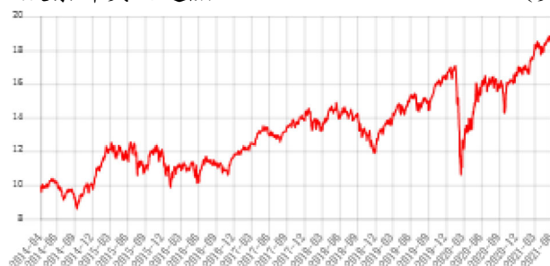
A股累計美元避險 (美元)

資料來源：Lipper, 截至110年6月30日。 此級別的成立日 - 103年4月09日